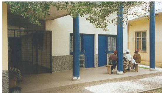
Entrée du centre de suivi