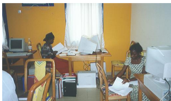
Salle de saisie