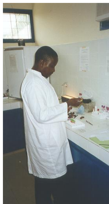
Salle de prélèvements