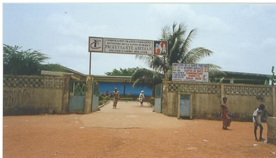
Entrée de la FSUcom d'Avocatier