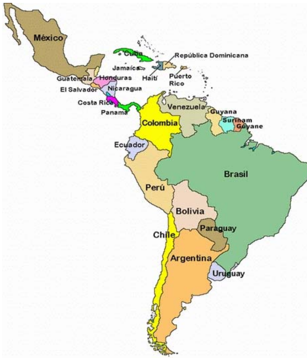
Carte 1 : La Guyane française en Amérique latine

tableau socio-sanitaire brossé ci-dessous va nous donner à voir les difficultés d'application du modèle socio-sanitaire français en Amérique du Sud.