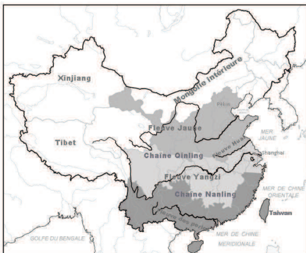
C 1-2 Les trois zones géoculturelles 5

Dans l'histoire, la Chine a connu cinq grandes migrations des «汉 Han» du nord au sud qui furent toutes causées par l'incursion des nomades. La principale raison de l'incursion réside dans la quête du pouvoir, de la richesse et du territoire. Entre les pâturages des tribus nomades et les champs des «汉 Han», il n'existe pas d'écran