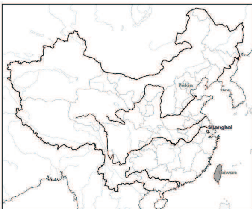
CA-5 L'île de Taiwan

Ce furent seulement des populations austronésiennes qui l'occupèrent jusqu'à l'époque de l'expansion économique maritime des Song du Sud (1127-1279). Depuis, les Han s'y sont installés pour cultiver des champs. En 1171, l'empereur Xiaozong (孝宗, 1127-1194) installa une garnison dans l'archipel Penghu (澎湖列島, les Pescadores en portugais) qui relève du district Jinjiang au Min du sud. Après sept navigations glorifiées entre 1405 et 1433, les Ming (1368-1644) décrétèrent l'embargo en 1563, puis le règne des Ming sur l'archipel fut démantelé par la Compagnie néerlandaise des Indes orientales en 1622. Deux ans après, les armées des Ming reprirent l'archipel et la Compagnie néerlandaise recula dans l'île de Taiwan où il n'y avait pas encore de gouvernement au sens strict. À partir de cette époque, les Hollandais encouragèrent la migration chinoise dans le but de développer l'agriculture. Après presque vingt ans de résistance infructueuse contre les Mandchous, Zheng Cheng-Gong (鄭成功, Koxinga, 1624-1662), conquiert Taiwan en 1662 et exerça une première gouvernance des Han sur l'île. Il mourut peu après. Après trois générations