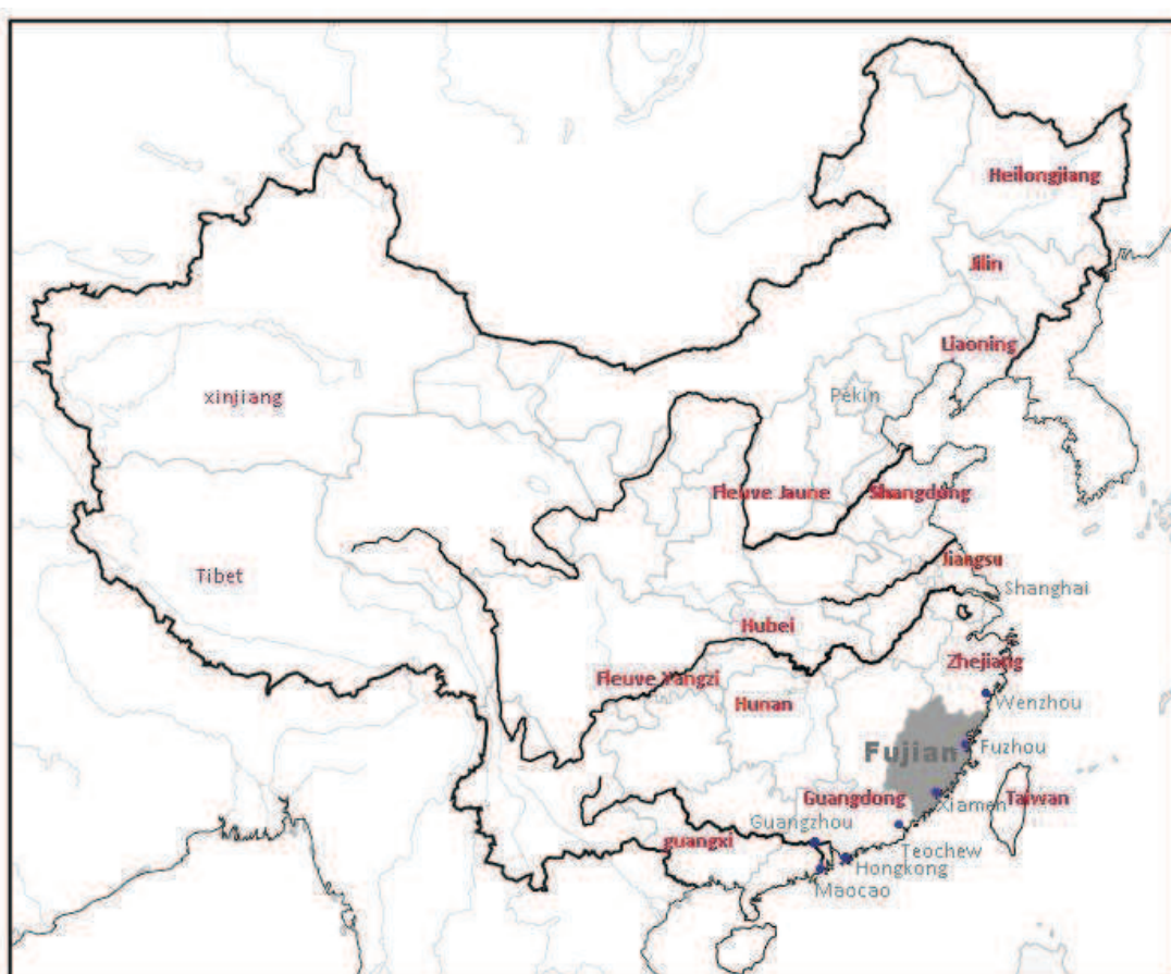
C 1-1 La carte de la Chine

Les provinces mentionnées se trouvent sur la carte de la Chine ci-dessous.